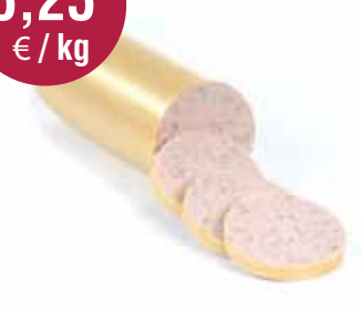
Tuinkruidenworst 1 kg