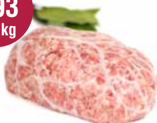
Vleesbrood in crepinet