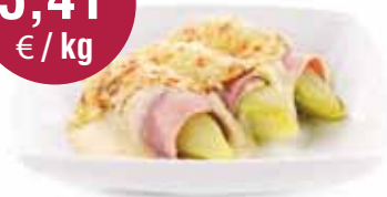
Witloofrolletjes met artisanale ham