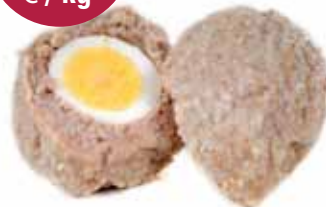
Vogelnestjes 30x170 gr