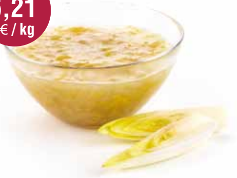
Witloofkonfituur met honing