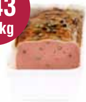
Pastei groene pepers 1 kg