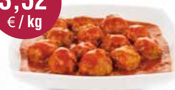
Balletjes in tomatensaus