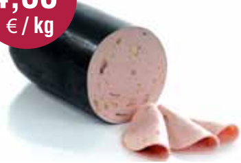
Champignonworst 2,5 kg