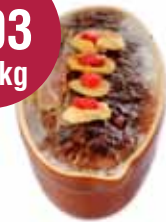
Pastei van de chef 1,50 kg