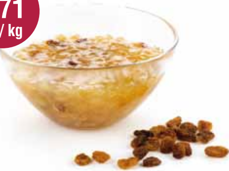
Ajuinkonfituur met rozijntjes