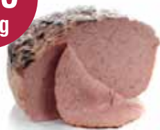
Vleesbrood gebakken 2 kg