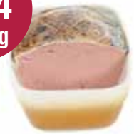
Kreempastei 2,15 kg