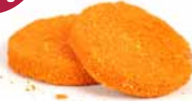
Gehaktburger - mini gehaktburger

onder atmosfeer Gehaktburger 15 x 130 gr = 4,89 €/kg Mini gehaktburger 30 x 30 gr = 7,00 €/kg