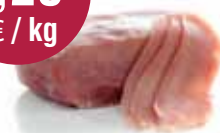
Gezouten hespenspek 2,15 kg