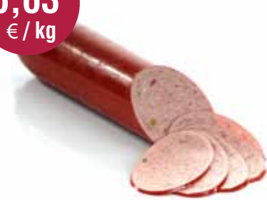
Bretoense worst 1,20 kg