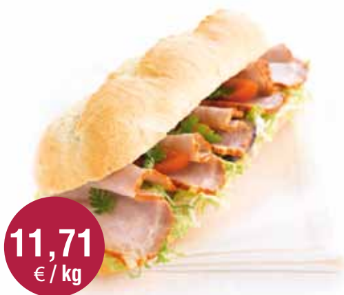
Roasted Pork Gebakken varkensgebraad

van de chef (varken) = 6,51 € préparé (rund) = 6,64 €