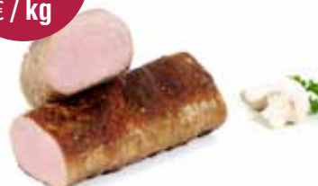
Varkensmedaillons 5x200 gr