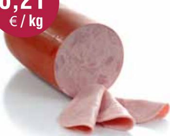
Parijzer worst 2,5 kg