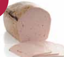
Vleesbrood Strasbourg 2,56 kg