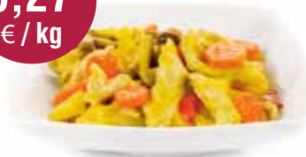
Kip curry chinees