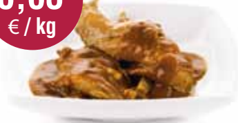
Konijn op Vlaamse wijze