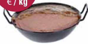
Ouderwetse pastei 2 kg