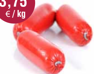
Hespeworst zonder look 500gr