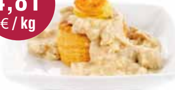
Vol au vent