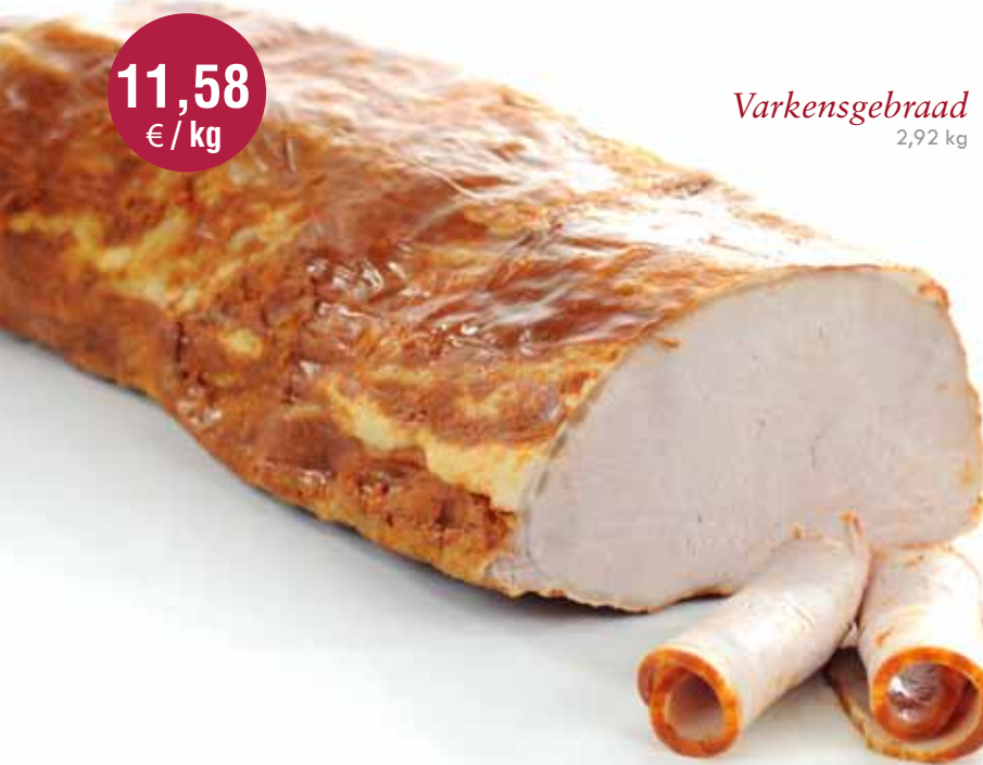
Varkensgebraad 2,92 kg