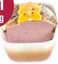
Ardeense pastei 3 kg