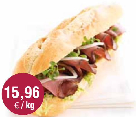
Roasted Beef Gebakken rosbeef