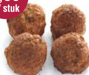
Gebraden gehaktballen 12x95 gr