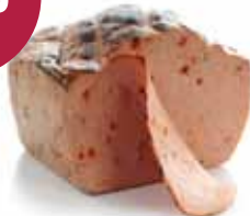
Provençaals vleesbrood 1,35 kg