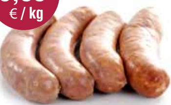
Kielbassa 1,34 kg