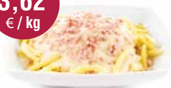
Macaroni met kaas & ham