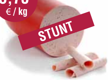
Hespeworst met of zonder look 2,5 kg