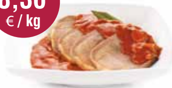
Rundstong in madeirasaus