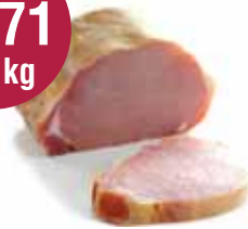
Ardeens gebraad VAC 0,95kg = 11,71 € ISP 6 x 150 gr = 12,44 €