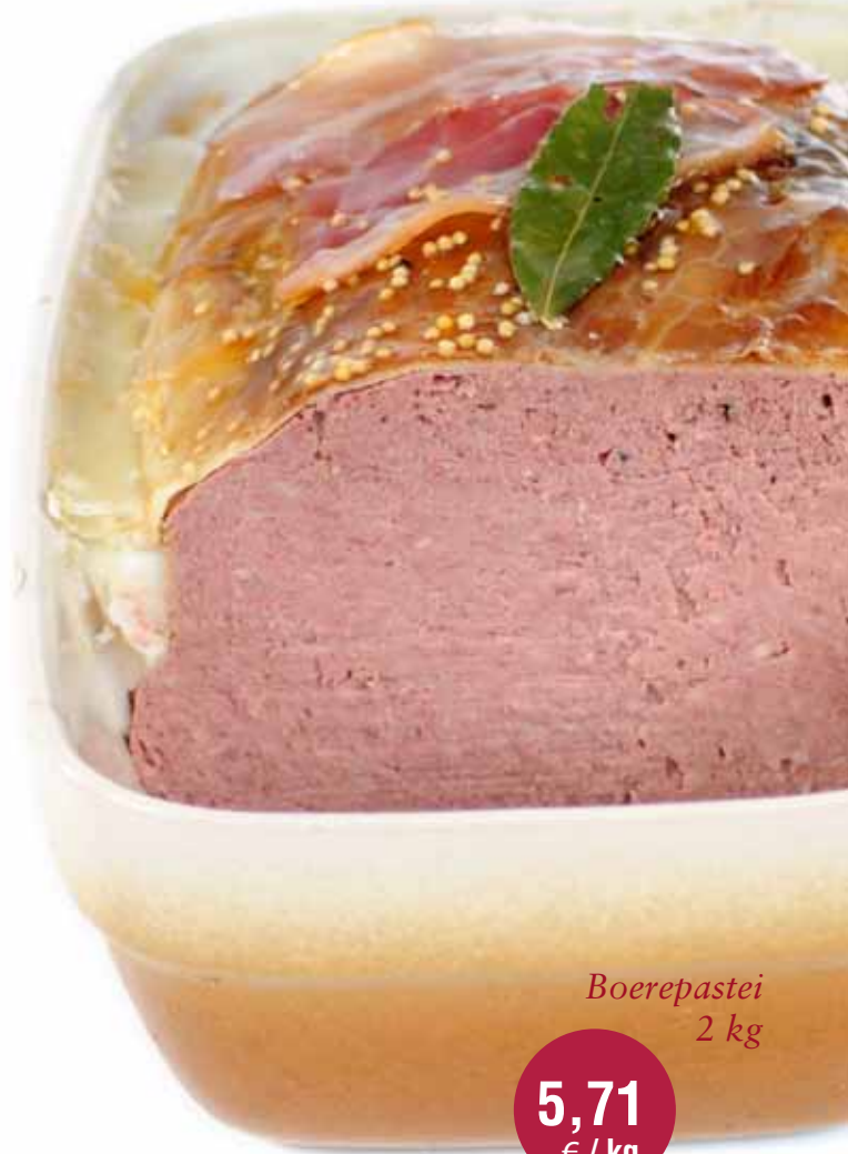
Boerepastei 2 kg