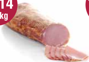
Gerookte Bacon 2,34 kg