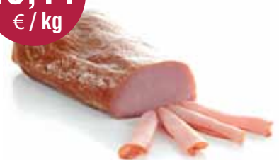
Gerookte bacon super 2,34 kg