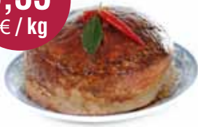
Pastei op bord 2,85 kg