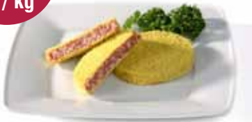
(mini) Kaasburger gepaneerd

onder atmosfeer Mini kaasburger 30 x 30 gr = 7,41 €/kg Kaasburger 15 x 130 gr = 5,56 €/kg