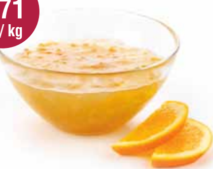
Ajuinkonfituur met sinaas