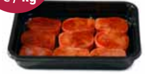
Country steak gemarineerd