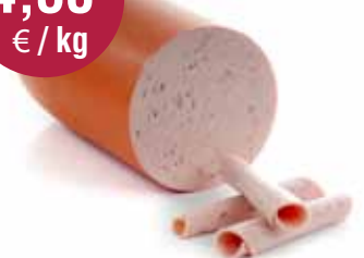
Kalfsworst 1 ste keus 2,5 kg