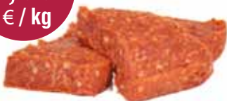
Mini T-bone burger